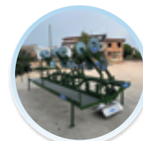
PEDANA OPERATORE (4 FILE)