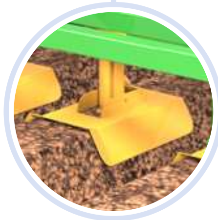
[ CAMPANA ] Hooded Unit