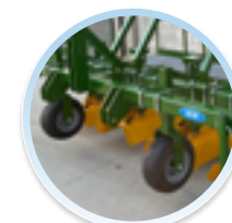
RUOTE DI SUPPORTO