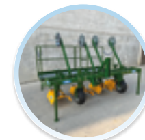
PEDANA OPERATORE (4 FILE)