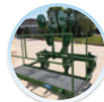
PEDANA OPERATORE (2 FILE)