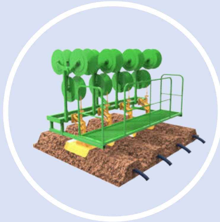
STENDIM. SWAN Swan Drip Tape Layer